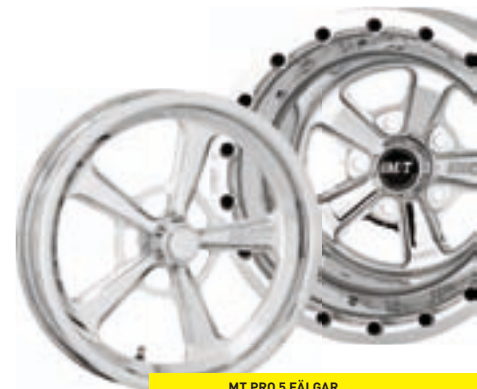
MT PRO 5 FÄLGAR

Produkterna på följande sidor är avsedda för tävlingsbruk. Nettopriser gäller.