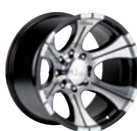
DC 2 BLACK

Svartlackerad DC 1 fälg. Muttrar samt kåpor ingår.