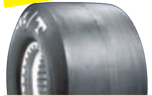
MT ET DRAG

Produkterna på följande sidor är avsedda för tävlingsbruk. Nettopriser gäller.