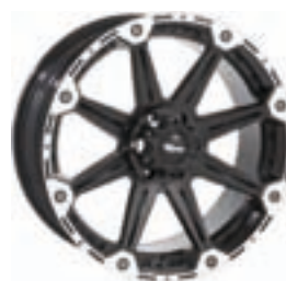
DC 1 TORQUE

Snygg, unik fälg med otrolig finish. Fälgerna är svart lackerad och finns till en rad moderna SUV samt Pickups. Muttrar samt kåpor ingår.