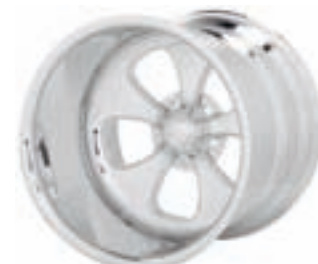
MT HR 1

Svartlackerad DC 2 fälg. Muttrar samt kåpor ingår.