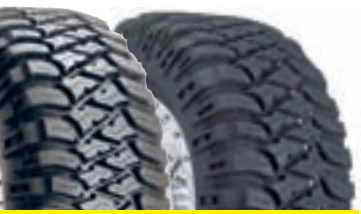
BAJA MTZ (Mönster A & B)

En ny radialkonstruktion med extra hållbarhet för körning i terräng men även på vägen. Speciell uppbyggnad som skyddar mot skärskador och ett självrensande mönster.