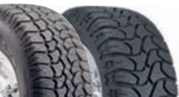
BAJA ATZ (Mönster A & B)

Speciell uppbyggnad som skyddar mot skärskador och har ett självrensande mönster. Konstruktionen tillåter att man kör med lågt lufttryck för bättre fäste. Extra stora "Sidebiters".