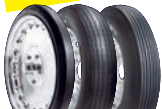
MT ET FRONT

Produkterna på följande sidor är avsedda för tävlingsbruk. Nettopriser gäller.