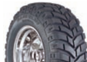
BAJA CLAW RADIAL

Baja Claw i radialkonstruktion. Ökar komforten på landsväg men med samma egenskaper som Baja Claw. Självremsande mönster samt "Side-biters"