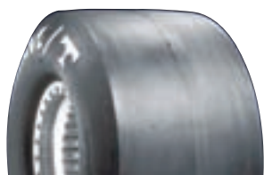
MT ET DRAG

ET Front är smala framdäck anpassade för att köra med på strippen.