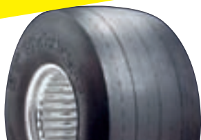
MT ET STREET

Produkterna på följande sidor är avsedda för tävlingsbruk. Nettopriser gäller.