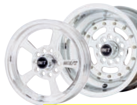
MT DRAG FÄLGAR

Första dragracingfälgerna i världen med dubbel Bed Lock som är gjord i ett stycke. Detta är även världens lättaste S.F.I godkända fälg.