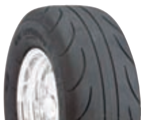
MT ET STREET RADIAL

Mjuk gummiblandning för maximalt grepp på strippen. Bygger på ET STREET, men med radialkonstruktion. D.O.T märkt.